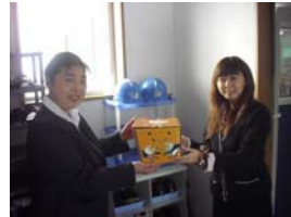
株式会社イー・エム・エス様