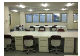
オフホワイトカラーで清潔感のある事務所