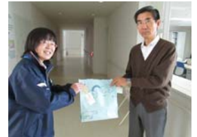
地域密着型特別養護老人ホームふる里えにわ様