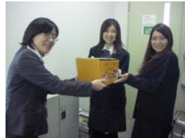
(財)日本食品分析センター様