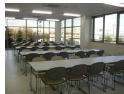
一部ガラス張りで景色も見える社員食堂