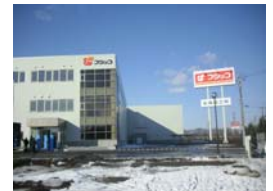
国道沿いにお馴染みの看板が見えます