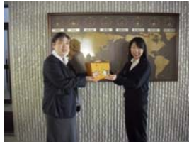
日本航空専門学校様