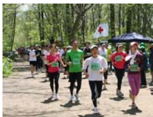
老若男女、走ることを楽しんでいます