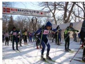
ホルメンコーレンマーチのスタート風景