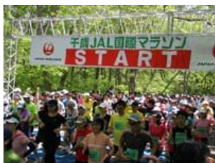
マラソンスタート風景