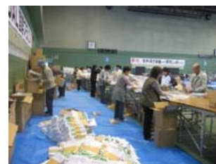
大会前日は大忙しです