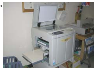
4月に千歳市内・小中学校の印刷機の入替えをさせていただきました