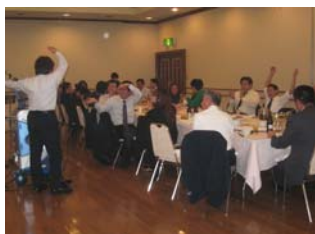
当社親睦会ゼネラルマネージャー S 氏は、本人顔負けの「YMCA」を振り付けつきで・・・若い2人には懐メロ

社員一同力を合わせ新たにパワーアップした「顧客喜点」で邁進したいと考えております。