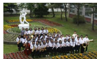
休み返上で練習に励んでいます。当日は、OB数名も出演予定です。