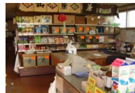
店内はお茶はもとより、包装資材やイベント用品がいろいろ →