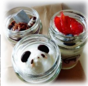
『ピンケーキ』オーダーケーキも依頼可能です（完全予約制）