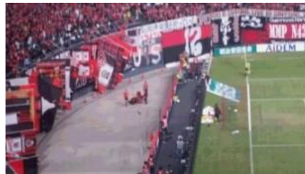
ロパスが2.5mぐらい落下！今期絶望かと焦りました