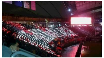
オープニングに「LIFE is RED & BLACK」の文字

勢いに乗り、第4節の鹿島アントラーズ戦も行ってきました。前半早々はコンサが鹿島ゴールに襲いかかたのですがシュートが決まらず、流れが鹿島に。鹿島のバランスの取れた攻撃にコンサの持ち味の高速カウンターを生かせず3-1で敗戦、ACLで中国から戻り札幌へと移動して来てアウェイで快勝の鹿島には、さすがとしか言いようがない感じでした。今期は新規加入の武蔵・ロパスがゴールを増産し、チャナティップ・宮沢・福森が活躍してくれると、上位進出も間違いないと感じる今期です。テレビで見るのとは違い、同じ空間で観戦するととても盛り上がりますので、皆でコンサを応援に行きましょう!!