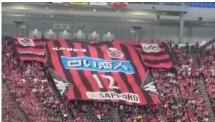
12人目の戦士も戦っています