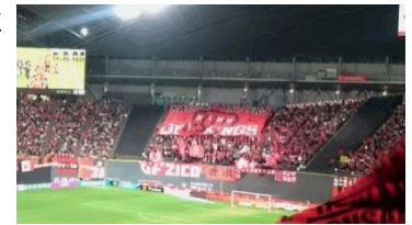
鹿島のサポーターも赤かったのでドーム全体が赤く染まりました