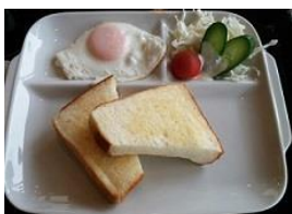
モーニングセット