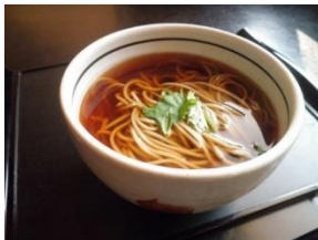
左 かけ 右 九割