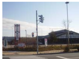
柏台にあるお店は駐車スペースも大きく、千歳アウトレットモール・レラ様が向かえ側にあります。