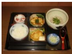
←店長おすすめ限定メニューです。