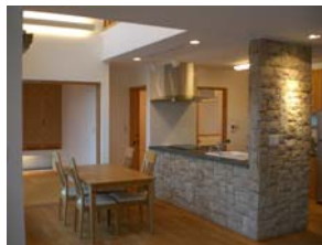
長都のモデルハウス。

内装の天然素材の色もやさしく、自然の力に癒されます。 人とともに呼吸し、深みを増す家になります。