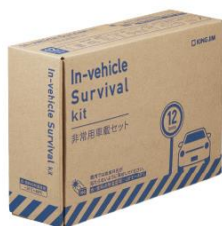
A5サイズのコンパクト設計

ブラックアウトから5年目を迎えて、身近なもしもに備えて使用期限を確認いただき、今一度ご検討ください。