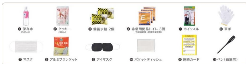
水や食料・トイレなど12アイテムのセット