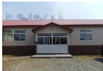
千歳職業技術専門校