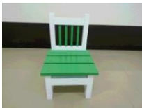
プランター用イス