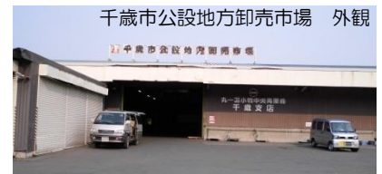
千歳市公設地方卸売市場 外観