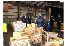
野菜のセリ売りの様子