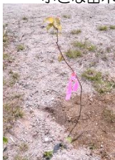
植樹した 小さな苗木

弊社では昨年よりボランティアとして参加をさせていただいており、今年度の初回は、総勢47名で植樹及び前回まで植樹したものに肥料をあげる作業をしました。