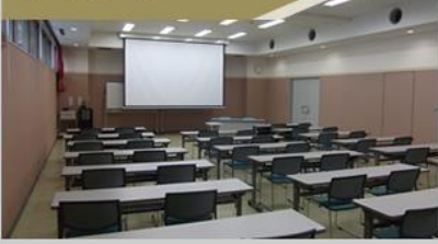
天井高3000mm 面積130m 2 (椅子のみで最大144名収容)