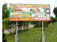
レストラン・アルカディア 看板が目印です