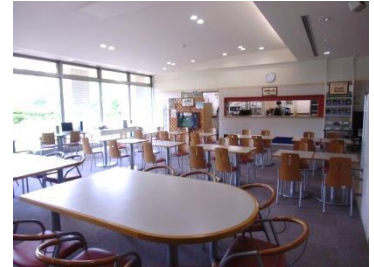
レストランへ是非お越しください