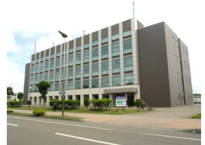
千歳アルカディア・プラザ 外観です