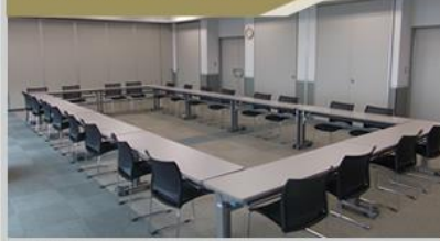
1室あたり50m 2 ~150m 2 (30名~108名 椅子のみで最大140名)、 時間単位の利用が可能です。

他にも横断幕やカッティングシールの作成ラミネート加工、コピーサービス等ビジネスをサポートするアイテムをたくさん取り揃えています。