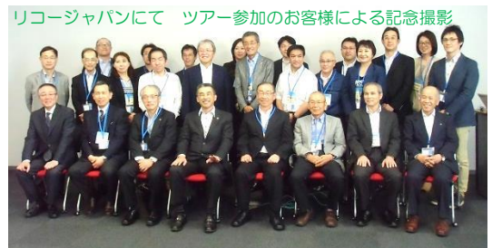
リコージャパンにて ツアー参加のお客様による記念撮影

床には道南杉を使用し、オフィス内のデスク天板にもカラ松を利用するなど最適な働く場のショールームです。