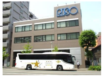
RISO 社屋前にて 今回の豪華な貸切バス