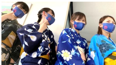
当社、小泉デザインの オリジナルマスクで参加しました