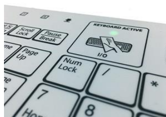
キー操作を無効化できるワンタッチキー