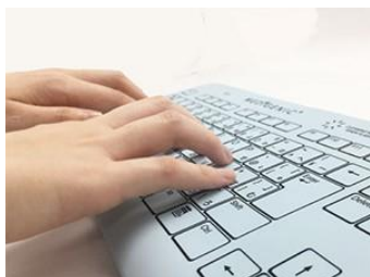
標準サイズのキー間隔