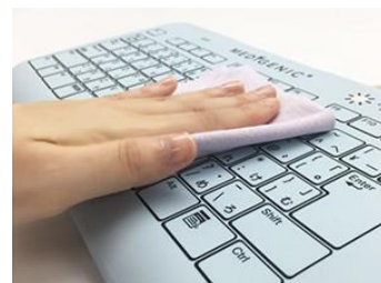
フラットな表面で拭き作業も簡単