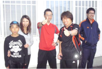
カミノ ウォーキング?ランニング大会