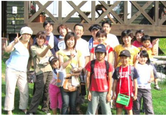
ニセコキャンプ with カミノ社員

子どもが育っていくのは当然ですが何故か寂しく感じることもあります…今はまだいろいろ制限された環境ではありますが学生生活が続く子も新社会人となる子たちもがんばって欲しいと願います🌸、(*・o・o・*)🌸