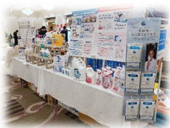
昨年のフェア会場の様子