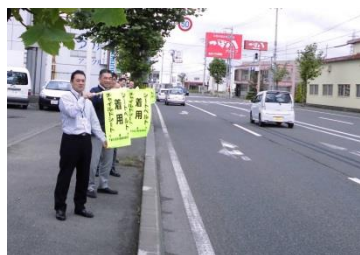
← 今年の啓発活動のようす

7月11日~20日 夏の交通安全運動期間中、朝『スピードダウン!!』や『シートベルト着用』の旗を掲げて、大通りを通行する車のドライバーの皆さんに、安全運転を呼びかけました。