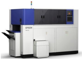
ペーパーラボ 「Paper Lab」

オフィスに設置できる小型製紙機「Paper Lab」です。セイコーエプソン(株)が2016年中に商品化を予定しています。使用済み一般コピー用紙を使い、1分間に14枚のA4用紙が作れます。8時間稼働させると6,000枚余りの用紙が出来るそうです。近い将来コピー機の横に「Paper Lab」が並ぶことになるかも知れません。