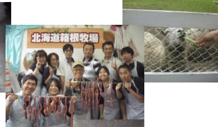
上：ソーセージの詰め作業 結構長いソーセージになりました。

現在 弊社で使用している販売管理システムが、10月より新しいシステムへ移行することに伴い、発行している 納品書・請求書 の様式が変わります。いろいろとご迷惑をおかけしますが、何卒よろしくご依頼致します。詳しくは、改めて お伝えさせていただきます。