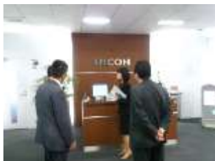
無人の受付。パソコンで担当者呼び出します。