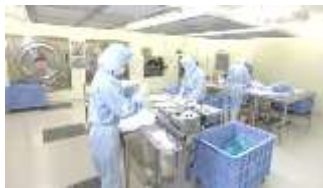
クリーンルーム内での作業