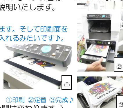
①印刷 ②定着 ③完成♪

Tシャツであれば10分少々で出来上がるようです。（印刷の彩度等で多少時間は変わります。）