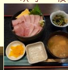
さすが!! 激ウマな 海鮮