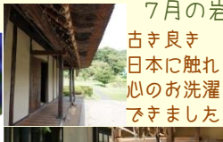
古き良き 日本に触れ 心のお洗濯 できました