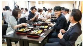
美唄にてランチタイム! 楽しく交流・情報交換

ランチタイムのあとは、札幌の【リコージャパン株式会社】へ移動。セミナーを受講し働きやすい環境作りの最先端ライブオフィスを見学。今後もまだまだお客様へのお役立ち情報をタイムリーに発信・ご提案していきます!