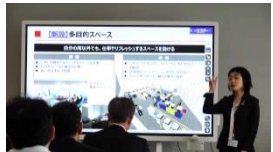
リコージャパン株式会社 セミナー受講とライブオフィスを見学しました。