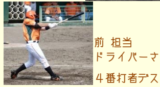
前担当 ドライバーさん 4番打者アス!