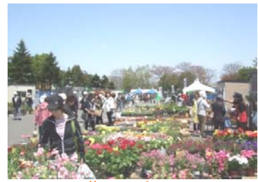
花フェスタ 毎年、花苗や樹木の販売・イベントが開催されています