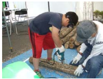
しいたけ栽培講習会 栽培を体験して、講習後は持ち帰り自宅です。