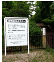
美々貝塚入口と説明の看板