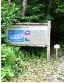
ウサクマイ遺跡入口

他にも二万年前の旧石器時代の遺跡等まだまだたくさん教えて頂いた場所がありますが、これから時間を見つけて見学に行きたいと思います。第二弾で拡大した地図の製作も検討中との事です。当社にも皆様にお配りできるように地図を本社とカパスに置いてあります。ご興味のある方は、是非当社営業にお声をお掛けください。（談：EYES・斉藤）