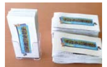
「千歳市遺跡地図」地図を片手に遺跡巡りはいかがでしょうか