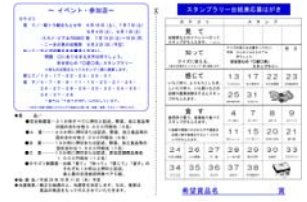
スタンプラリーカードです

6月6日(水)・7日(木)に前号よりご案内してありました「KAMINO PRESENTATION FAIR 2012」を開催しました。