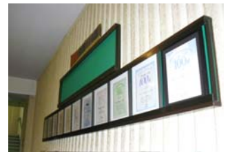
マラソン100撰の賞状。 全国区の大会になりました