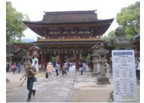
「大宰府天満宮」。 私ももっと知恵が付くよう お願いしてきました