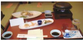
ふぐ料理 初めて食べた「ふぐの刺身」 は忘れられない味です