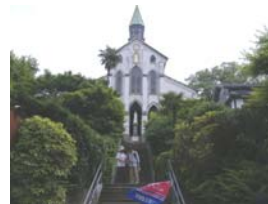
教会として日本唯一の 国宝建築物「大浦天主 堂」。趣がありました