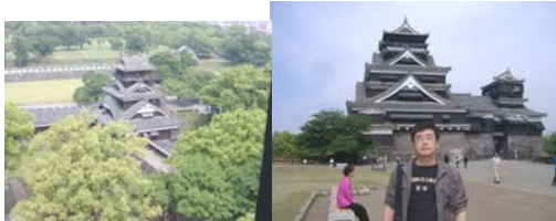
加藤清正築城の「熊本城」。 雄大な歴史ロマンを感じました