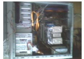
マイパソコン。まだ配線がぐちゃぐちゃですが、こんな感じに組んでみました。