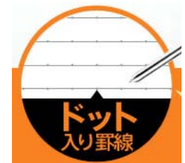
2.キャンパスノート