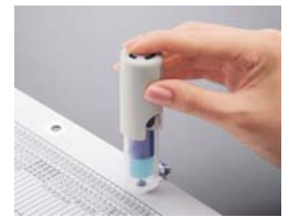
1.ワンパッチスタンプ