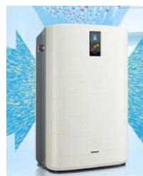
空気清浄機も好評です。特に加湿空気清浄機は冬には必需品。