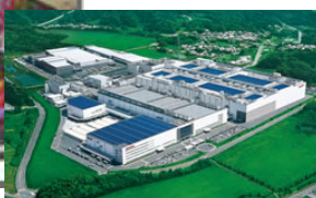
シャープが誇る亀山工場は、環境にも考慮した「スーパーグリーンファクトリー」