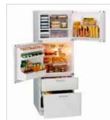
1988年に発売された両開きの冷蔵庫。当時は画期的で驚きでした。