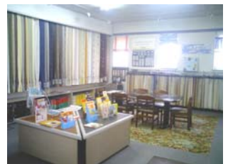
ショールーム。たくさんのサンプルがありました