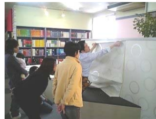
クロス貼り教室。 プロの技を教えてください。 お客様には好評です。