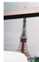
話題の東京タワー。展望台からの東京の街並み「都会」を感じたそうです。