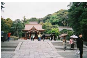
修学旅行定番の寺院見学。