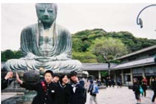
鎌倉の大仏様の前で。 願うは“合格祈願”