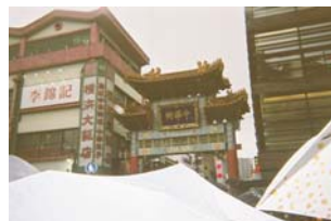
横浜中華街。 お土産選び四苦八苦・・・